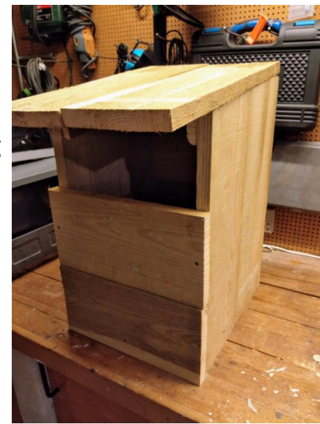
Samlet kasse uden Hulplade. (Mangler maling og tagpap)